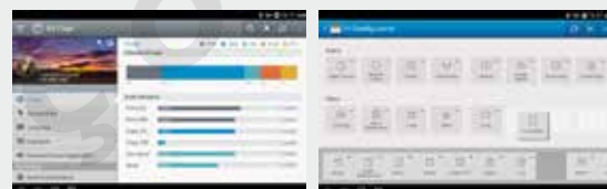
Personalização UX (Minha Página)

Os aplicativos de impressão são pré-carregados, incluindo Copiar, Digitalizar/Enviar Caixa, Status de Trabalho, Contador, Configurações, Construir Tarefa, Agenda de Endereços e Ajuda, o que fornecem aos usuários uma usabilidade mais conveniente. E ainda mais, há widgets personalizados para criar acesso instantâneo com um toque para funções frequentemente usadas.