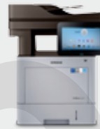
M4580FX (45 ppm)